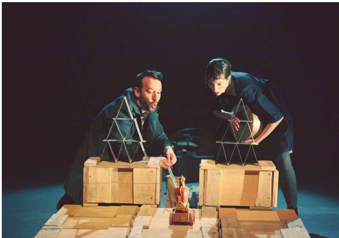
© Patrick Simard, Le petit cercle de craie

C'est d'outre-Atlantique, du Canada, et plus précisément du Québec, que nous vient La Tortue Noire pour un temps fort. Une occasion unique de découvrir deux pièces emblématiques de leur répertoire et leur dernière création.