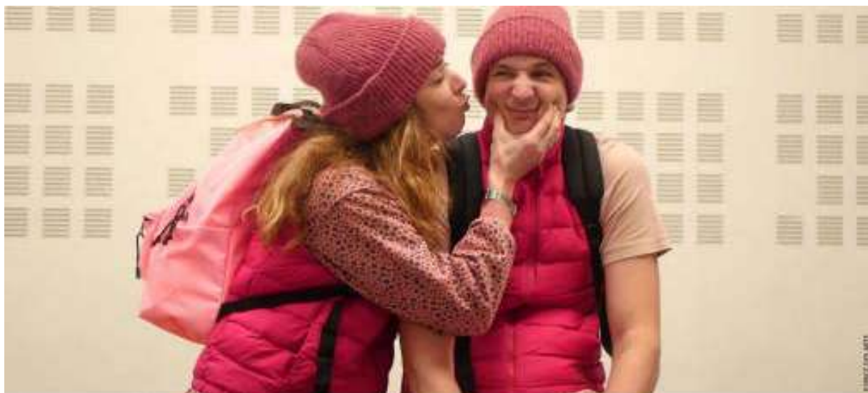
Renversante, une production de l'Espace des arts