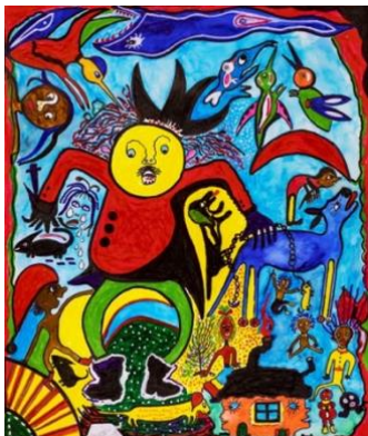
Corinne Deville Sans titre Décembre 2007, Epalinges Collection privée