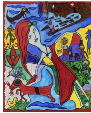
Corinne Deville Sans titre Octobre 2006, Epalinges Collection privée