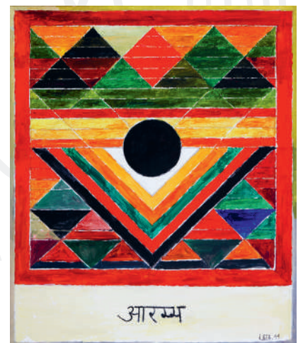
Aarambh , acrylique sur toile, 120 × 100 cm, 2015

“ Le temps n'est pas la véranda de la petite école du village Où ton maître avait dessiné un bindu sur le mur Te demandant d'oublier tout le reste et de te concentrer sur lui — Ta main passe, encore et encore, sur ce bindu lointain Et l'univers entier s'illumine chaque fois. Le temps n'est pas une fenêtre qui donne sur la rue Tu l'ouvres de temps en temps Laisse entrer le soleil Vois s'il fait vent ou s'il fait froid — Mais il n'en passe rien dans tes couleurs et tes formes. Le temps n'est pas une maison en pierre entourée d'arbres et de buissons Tu étends parfois ton papier sur la lourde table de pierre Et parfois tes aspirations Et parfois la tristesse de toute une vie, Mais tu ne peux y habiter Parce que tu habites tes couleurs impérissables, Leur éclat fulgurant, La sombre vibration entre leurs couches. (Extrait du poème d'Ashok Vajpeyi « Le temps de Raza ») ”