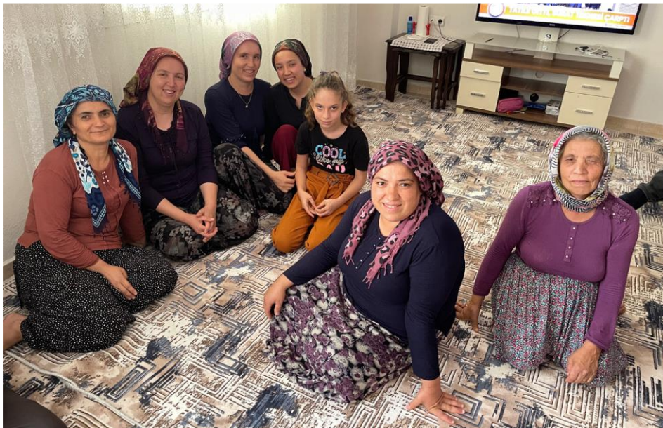
Été 2021 : Première rencontre avec ma famille, dans le village de mon père

Après plusieurs tentatives de choix infructueux (j'ai moi-même testé trois filières universitaires avant de faire du théâtre), elle se décide à aller voir une conseillère d'orientation. Cette femme, personnage pittoresque à la personnalité déjantée, l'incite fortement à se pencher sur ses origines turques dont elle ne connaît presque rien.