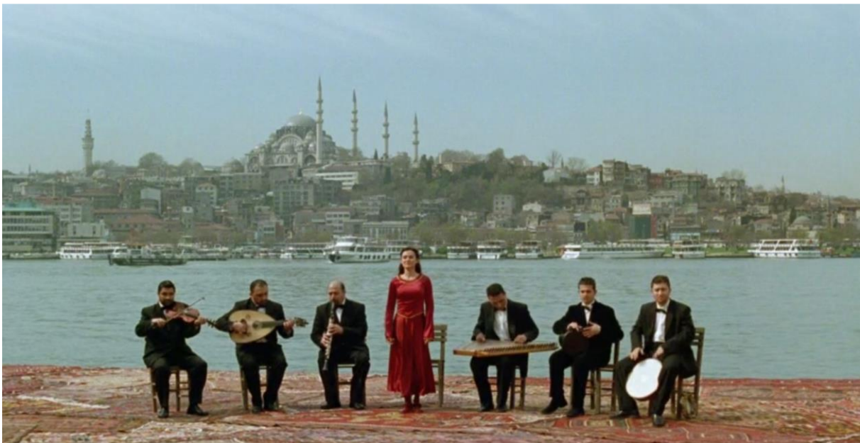
Head on de Fatih Akin

Ma mère est française, mon père turc : l'impact de cette double culture sur ma construction en tant que jeune femme adulte, voilà ce qui est apparu au cœur de cette question du désir. En dépassant une certaine pudeur sur mon origine turque, j'ai compris que c'était précisément cette réticence à l'aborder qu'il s'agissait d'aller creuser. Euphrate est alors devenue mon double fictionnel dont j'espérais qu'il puisse soulever, à travers ma propre histoire, une histoire plus large que la mienne.