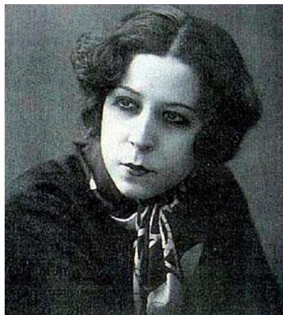
Afife Jale, première actrice musulmane en Turquie (1902-1941)

Pour la forme du spectacle, j'ai fait le choix d'une grande simplicité scénographique. Mon objectif est de tisser une théâtralité dans l'alternance entre des dialogues très vifs et incarnés, empreints d'une certaine drôlerie, et des séquences physiques burlesques ou dansées, rencontres incongrues de Jacques Tati avec le hip hop. Au final, il s'agit de raconter avec la liberté d'un corps joyeux le long chemin vers l'affirmation d'un désir de vie.