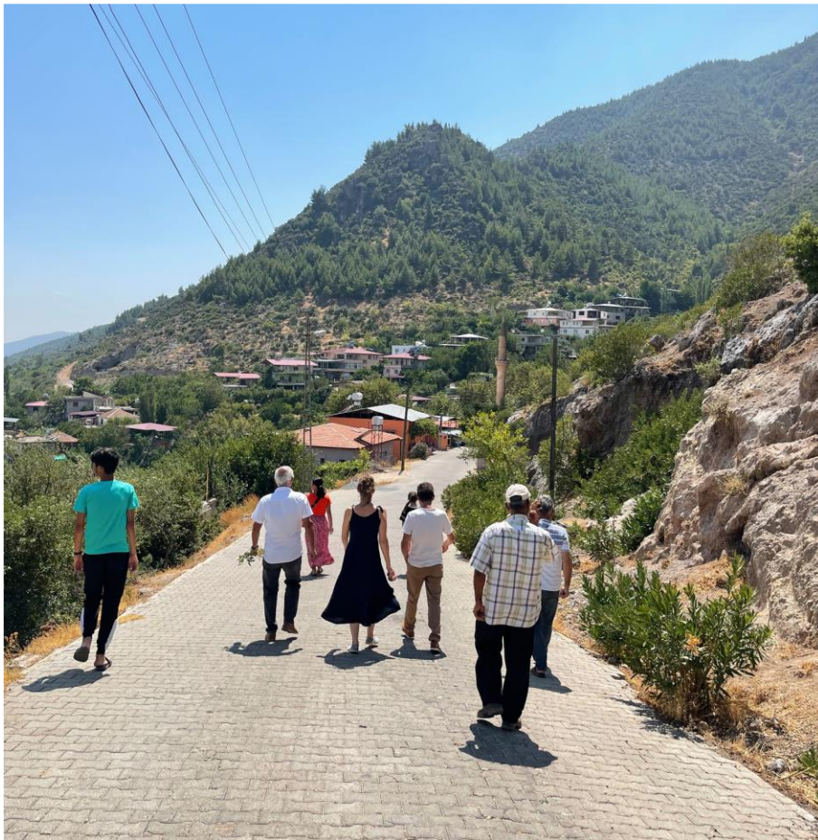
Turquie, été 2021.

Le souvenir d'un rêve d'enfance, en particulier, lui revient : celui de devenir « professeur des spectacles », autrement dit comédienne. Elle se rappelle cette appétence pour la scène, pour la liberté d'un corps joyeux et expressif offert au regard du public. Mais dans le même temps lui reviennent également des paroles de son père, qui répétait volontiers qu'une femme se doit de rester « discrète », et qu'il serait honteux que sa fille s'expose un jour sur une scène. Quel héritage de cette tradition pèse aujourd'hui sur ses épaules, sur les miennes ? C'est une des questions que je pose dans ce spectacle.