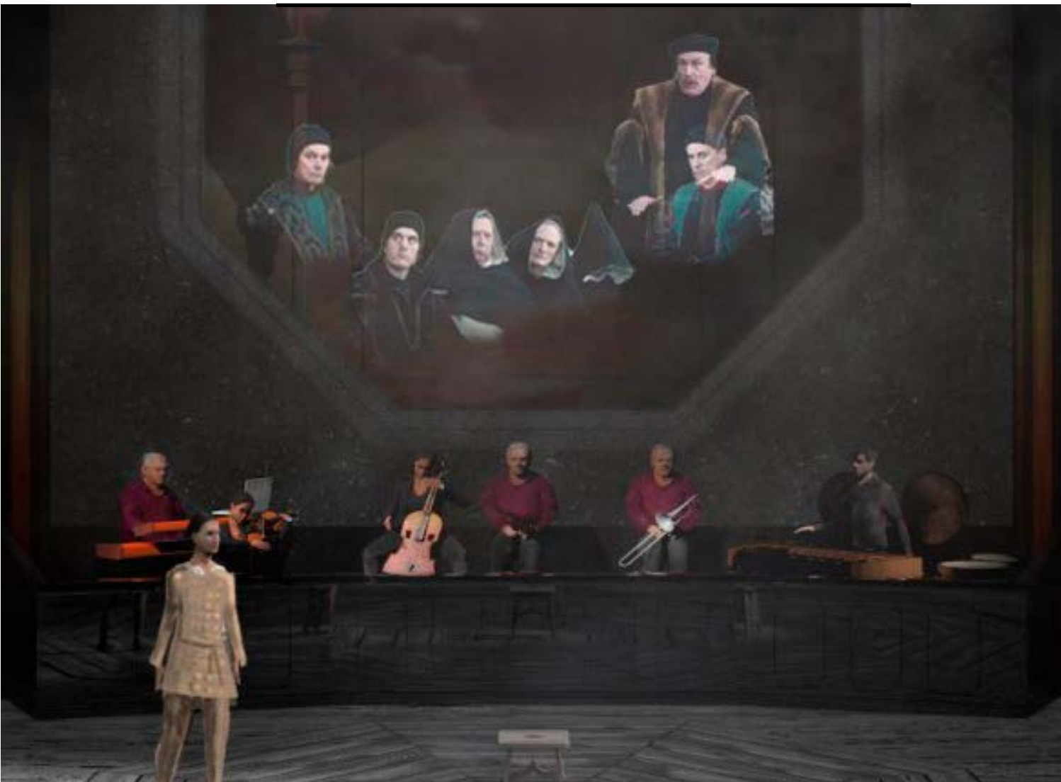
Photo ci-contre de la pièce Le Procès de Jeanne , création vidéo interactive de Pierre Nouvel