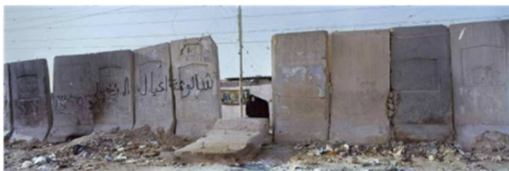
Mur de l'armée américaine à Bagdad. Irak, 2012

N'est-ce pas notre monde en entier que nous essayons de questionner avec cette pièce « La Clairière » ?