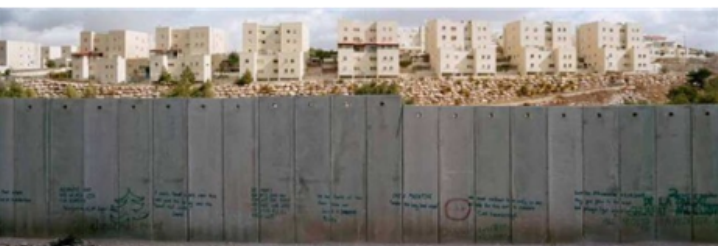
Mur entre Palestine et Israël depuis le camp de réfugié de Shuafat dans les environs de Jérusalem. 2009