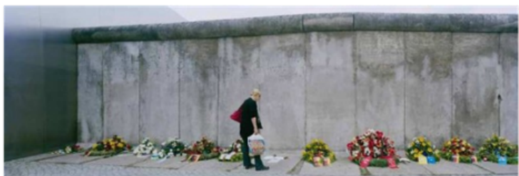
Fleurs rendant hommage aux personnes ayant tenté de franchir le mur de Berlin. Allemagne, 2011