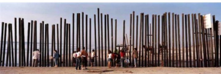
Fin de la frontière au Mexique et Etats-Unis sur le Pacifique. Tijuana, Mexique, 2008

Aujourd'hui, des murs qui empêchent la paix dans le monde, des murs qui séparent les peuples. La construction d'un mur est un événement contre la paix et la tolérance dans le monde et souvent un motif de tensions. Le photographe Kai Wiedenhöfer qui a assisté à la chute du mur de Berlin, témoigne à l'aide de ses photos, les principaux murs de notre époque, comment ils séparent les communautés et influent sur les conflits.