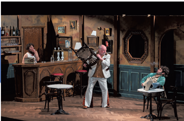
P6 / 7

Un père part à la recherche de son fils disparu. Guidé par un mystérieux magicien, il assiste à des fragments de sa vie. Mais est-ce réel ou une illusion ? La mise en scène inventive de Frédéric Cherbœuf, qui dialogue avec le cinéma, révèle toute la modernité de cette réflexion sur les images, les apparences et le pouvoir du théâtre.